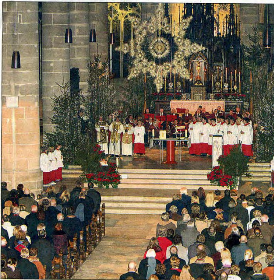
Heiligabend im Münster – wie immer zu diesem Anlass brechend voll –

24.12.2006 Christmette im Heilig-Kreuz-Münster