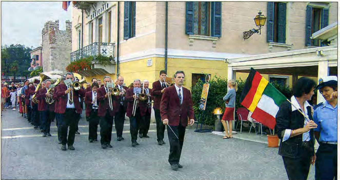
Erlebnisreiche Tage verbrachte die Kolpingkapelle am Gardasee. Musik in Bewegung zu Wasser, in den Straßen und Gassen und der musikalische Aperitif mit einem Platzkonzert im Hafen machten Spaß und kamen bei den Festbesuchern gut an.

Am Samstag, 21. Oktober, wirkt die Kolpingkapelle beim Galakonzert zum Jubiläum des Akkordeonorchesters Penz im Stadtgarten mit. Als Kontrast zur Unterhaltungsmusik der Sommersaison wird in den nächsten Wochen immer dienstags im Franziskaner auf das weihnachtliche Konzert im Heilig-Kreuz-Münster geprobt.