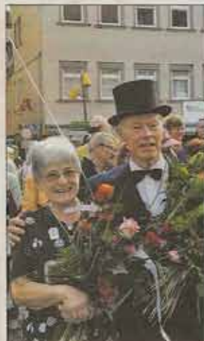
Alle Festteilnehmer waren am Schluss des Umzugs vollbepackt mit Blumen.

Heute findet der Abschluss der Feierlichkeiten des AGV 1936 im Rahmen des 80er-Festes statt. Traditionell steht die Blaufahrt auf dem Programm, von der die Teilnehmer heute gegen 21 Uhr zurückkehren werden. Das 80er-Fest war das letzte Jahrgangsfest in Gmünd in diesem Jahr. Es fand übrigens eine Woche später als üblich statt. Grund waren die Schwörtage, die eine Woche zuvor in der Gmünder Innenstadt stattfanden und einen Festumzug natürlich räumlich nicht zuließen. Weiter geht es also am 10. Juni 2017, wenn dann die 40er wieder laufen.