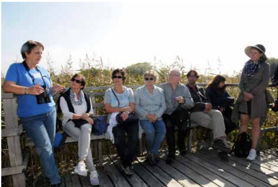
Die Bilder spiegeln zwei erlebnisreiche Tage wider: links rund um die Meersburg, rechts am Federsee