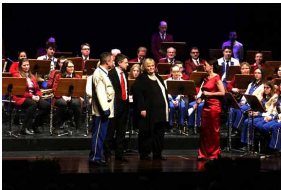
Das Projektorchester zum Neujahrsempfang 2016

Gemeinsame Proben mit dem Musikverein Herlikofen, der Schwäbisch Gmünder Stadt-Jugendkapelle und dem 1. Musikverein standen für die Kolpingkapelle am Jahresanfang des Jahres 2016. Das Ziel der Neujahrsempfang des Stadtverbandes Musik und Gesang am 10. Januar. Das Projektorchester gestaltete hierzu den Auftakt zum Neujahrsempfang, der gleichzeitig Auftakt für das Jubiläumsjahr zum 50-jährigen Bestehen des Stadtverbandes Musik und Gesang war.