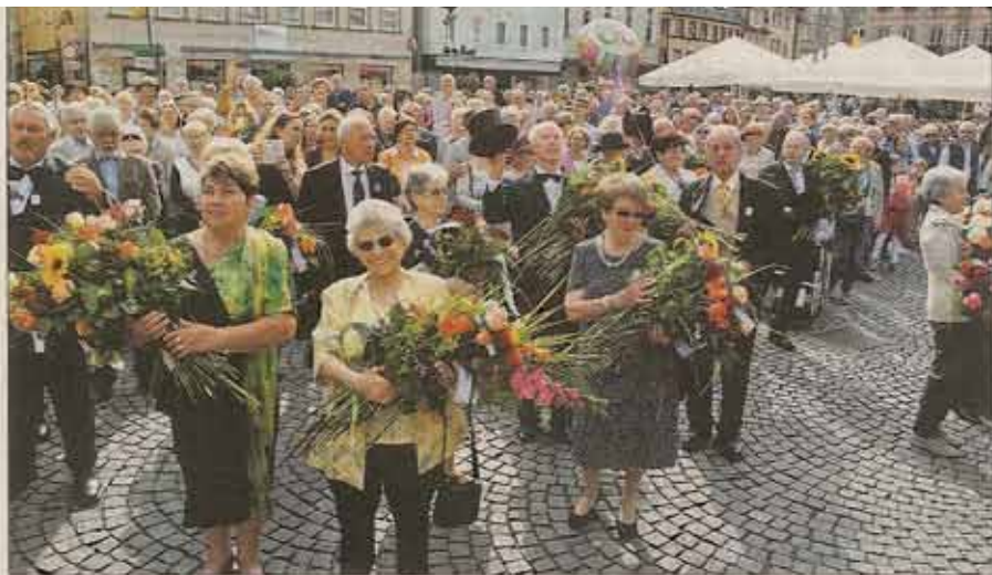
Zum fünften Mal in diesem Jahr sangen die Altersgenossen auf dem Marktplatz unter dem Johannisturm den „Alois“. Am Samstag waren die 80er dran. 33 Altersgenossen wurden dabei lautstark von einer großen Menschenmasse unterstützt.