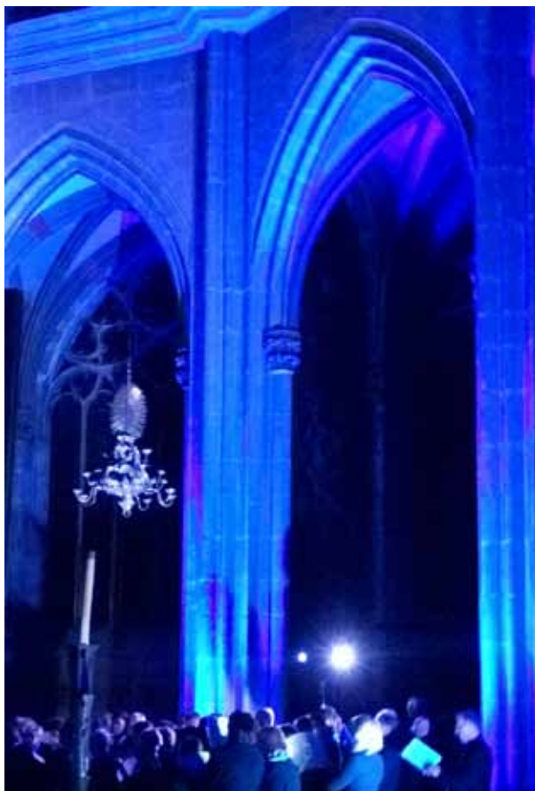
Das Münster in festliches Licht getaucht durch Andreas Zengerle

Will man vom Spendenerlös 2016 auf das Konzert schließen, so muss es ein besonders schönes Konzert gewesen sein. Über Karl-