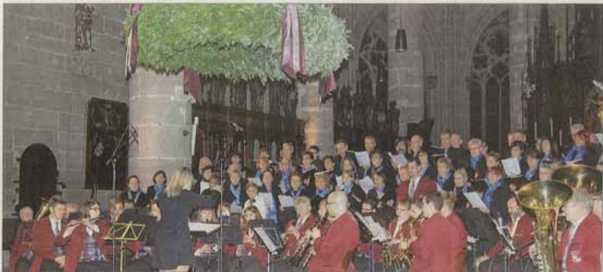
Ein gewaltiger, sowohl die vollen als auch die leisen Töne beherrschender Klangkörper aus Instrumenten und Stimmen war gestern Abend im Münster zu hören.