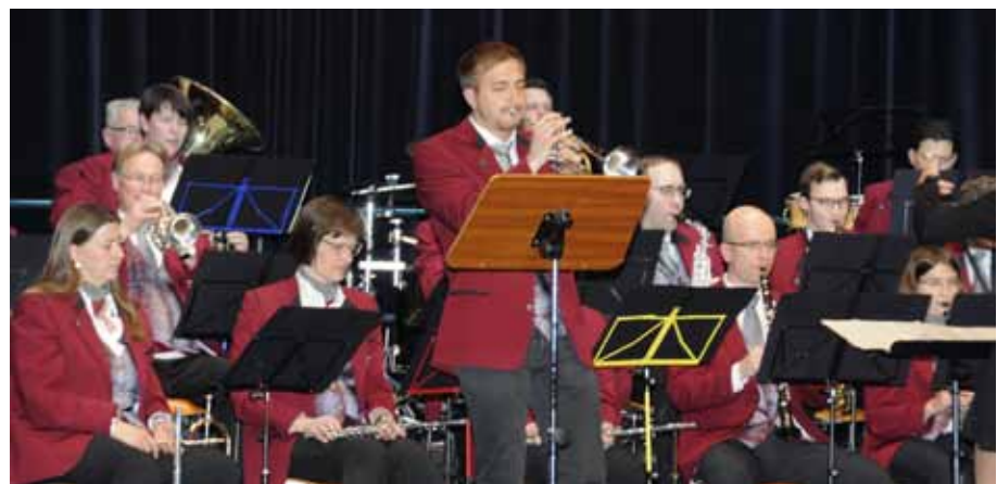
Eine regelrechte Solistenparade wurde von Kolpingkapelle und Schwörhaus Bigband im Stadtgarten aufgeführt.

Text Wolfgang Stütz