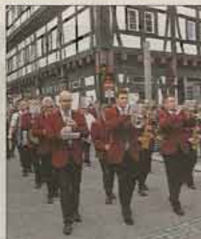
Für die musikalische Unterhaltung sorgte die Kolping-Kapelle Schwäbisch Gmünd.

Begonnen hatten die Festlichkeiten bereits am Donnerstag mit dem Begrüßungsabend um 18 Uhr im Restaurant „Fuggerei“. Am Samstag trafen sich dann die Altersgenossen um 8 Uhr zum Sekstrunk auf dem Kornhausplatz wo gegen 8.45 Uhr die Umzugsaufstellung eingenommen wurde. Insgesamt 33 Altersgenossen nahmen dann am Umzug teil, alle sehr gut zu Fuß und bestens gelaunt unterwegs. Lediglich eine Festteilnehmerin ließ sich am Ende des Zuges mit einem Cabriolet fahren. Aber auch sie verließ das Fahrzeug dann auf dem Marktplatz, um die Gmünder Hymne, den „Alois“ im Stehen zu singen.