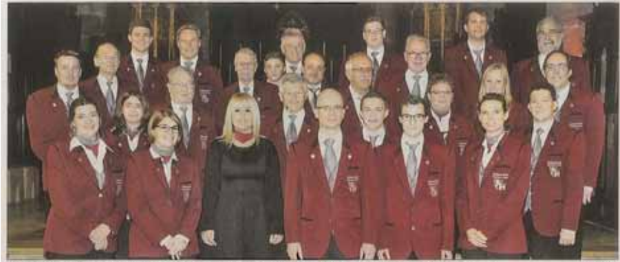
Die Kolpingkapelle Schwäbisch Gmünd ist im Aufbruch. Viele junge Musikantinnen und Musiker haben sich dem traditionellen Klangkörper angeschlossen.