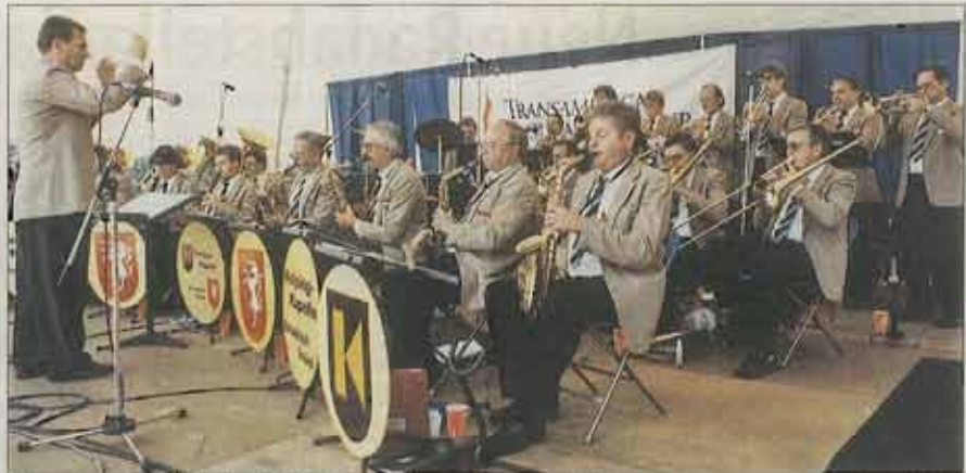
Bei ihren Auftritten in Bethlehem hatte die Schwäbisch Gmünder Kolpingkapelle großen Erfolg.