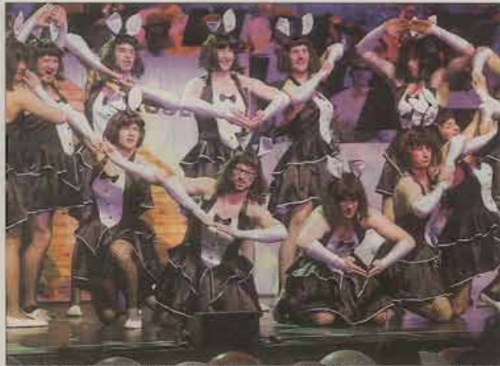
Die „Mädels“ vom Männerballtanz aus Herlikofen als Grazien im Bunny-Hasen-Kostüm.